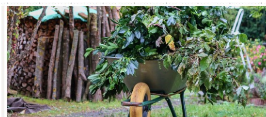
Grünannahme Lembeck und Rhade

Es gibt Gespräche mit einem Rhader Verein, auf Lembecker Boden. Noch ist aber nichts spruchreif.